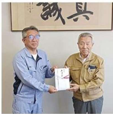
平櫻会長⑥と明星会長